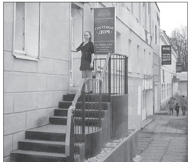
Так сейчас выглядит «Гостевой дом «Мста»