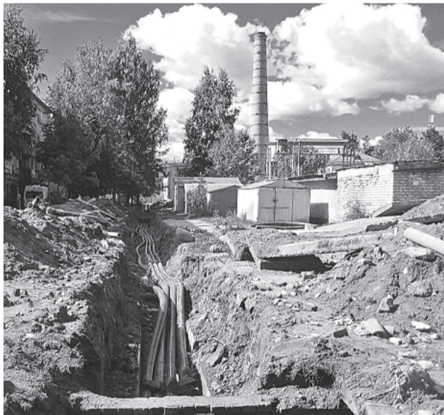
Ремонт на улице Боровой.

полнения — до 1 мая). Территория, прилегающая к многоквартирным домам, постоянно подтопляется. Содержать и ремонтировать «ливнёвку» на территории города в текущем году, на основании проведённого в марте аукциона, будет ООО «Спецтранс». На эти цели в бюджете запланировано 2 миллиона рублей (1 млн. — на капитальный ремонт, 1 млн. — на содержание).